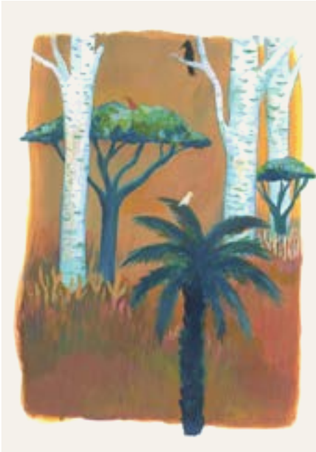
Voorbeeld verhaalkaart fase 4 (aankomen).

De meest voor de hand liggende werkwijze is om het verhaal te vertellen en per fase enkele vragen te stellen. Men kan ook meer aandacht besteden aan één bepaalde fase (zie Van Acker et al. , 2020). Voor opvoedingsvragen en gezinsdynamieken is de vierde fase de meest relevante: de eerste fase van het aankomen, die gezinnen dus in de opvang doorbrengen.