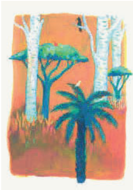
Voorbeeld verhaalkaart fase 4 (aankomen).

De meest voor de hand liggende werkwijze is om het verhaal te vertellen en per fase enkele vragen te stellen. Men kan ook meer aandacht besteden aan één bepaalde fase (zie Van Acker et al. , 2020). Voor opvoedingsvragen en gezinsdynamieken is de vierde fase de meest relevante: de eerste fase van het aankomen, die gezinnen dus in de opvang doorbrengen.